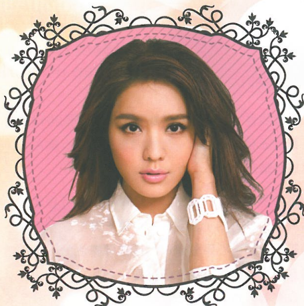
官恩娜小姐 Ms. Koon Yan-Na (Ella)