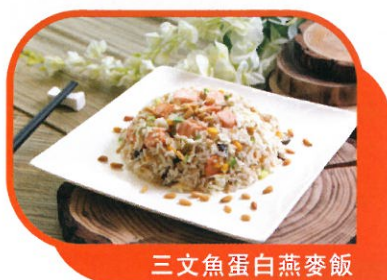
三文魚蛋白燕麥飯