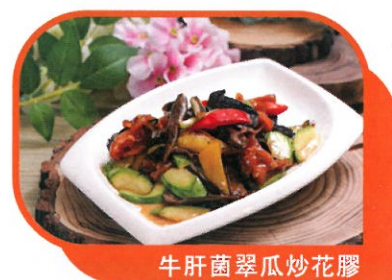
牛肝菌翠瓜炒花膠