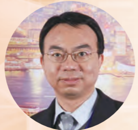
香港心臟專科學院前院長 陳鑑添醫生