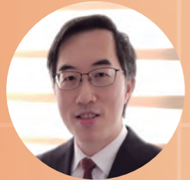
香港心臟專科學院前院長 陳藝賢醫生