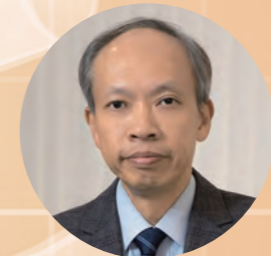
香港心臟專科學院前院長 李樹堅醫生