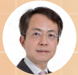
香港心臟專科學院前院長 劉柱柏教授