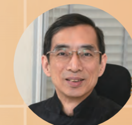
香港心臟專科學院前院長 劉育港醫生